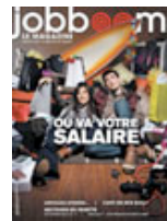
Magazine Jobboom Vol. 10 no. 1 janvier 2009

Recherche d'emploi Curriculum vitæ Entrevue Négociation Nouvel emploi Réorientation Conseiller en ligne